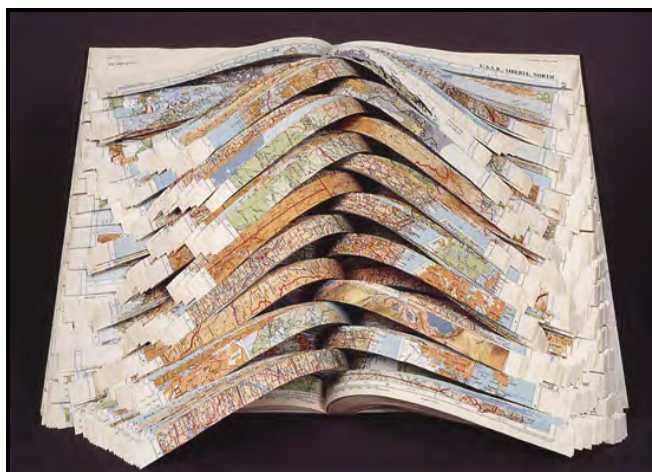
FIGUUR 9: Doug Beub, Fault lines (Verskuiwingslyne) , gewysigde atlaspapier, 2003.