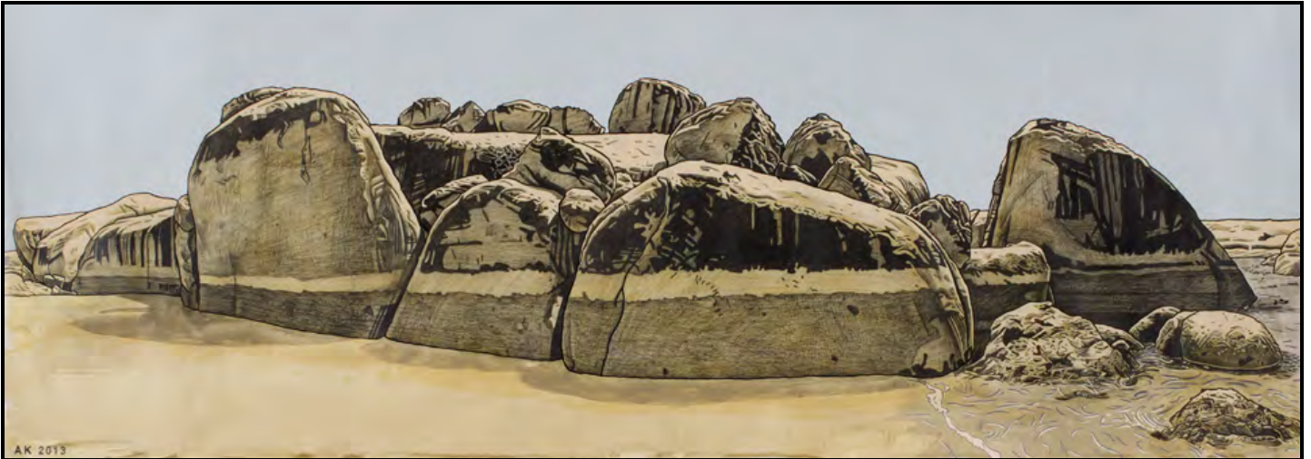
FIGUUR 2: Anton Kannemeyer, Boulders Beach, Simon's Town (Boulders-strand, Simonstad) , potlood, swart ink en akriel, 2013.