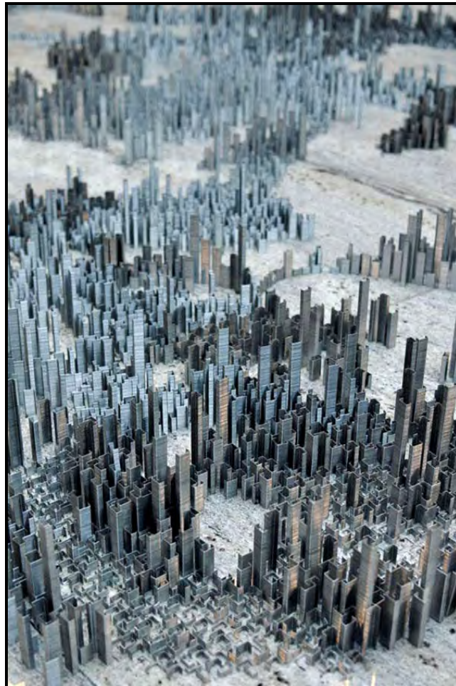
FIGUUR 8: Peter Root, Ephemicropolis , stad van krammetjekuns, installasie wat bestaan uit 100 000 krammetjies, 2012.

Is 'n stedelike landskap dus maar net 'n landskap van 'n stad? Of is dit meer as dit?