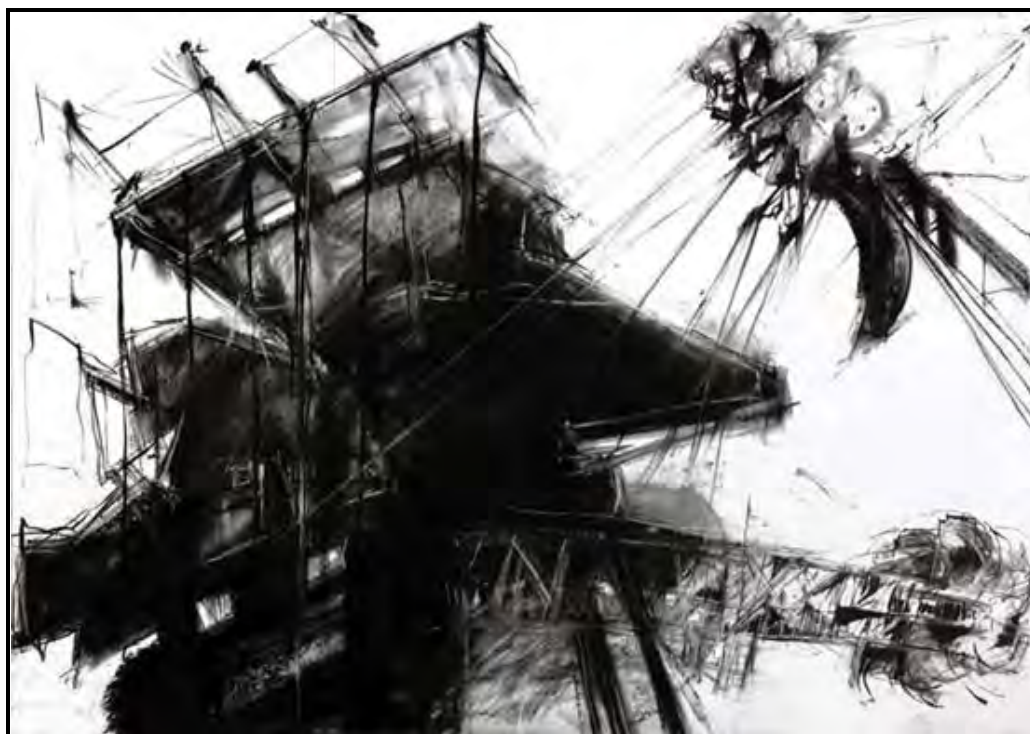
FIGUUR 5: Jeannette Unite, Residu Mine Machines & Residues of Power (Residu-mynmasjiene & Oorblyfsels van Mag) , monumentale tekening op katoenveselpapier in etswerk, houtskool, kunstenaarvervaardigde pastelle wat goudmynstof, metaaloksiede en mynhoop-oorblyfsels bevat, 2012.

Africa the motherland NATION Africa the land of my forefather Africa the land of my great ancestor once roamed Africa the land of many communities Africa the land of my birthplace Africa the second largest continent on EARTH Africa the land which everybody imitates Africa the land which everyone talks about Africa the land which everyone is jealous about Africa the land that brings beauty in all of us Africa the land of great leadership Africa the land of great powers Africa the land of bright futures Africa the land of great traditions Africa the land of good food Africa the land of vast populations Africa the land of real precious diamonds Africa the land of UNITY Africa the land of hard working people Africa the land that lord gave to us Africa the land that I love Africa the land that I will SOON return to – Obi Onyenwe