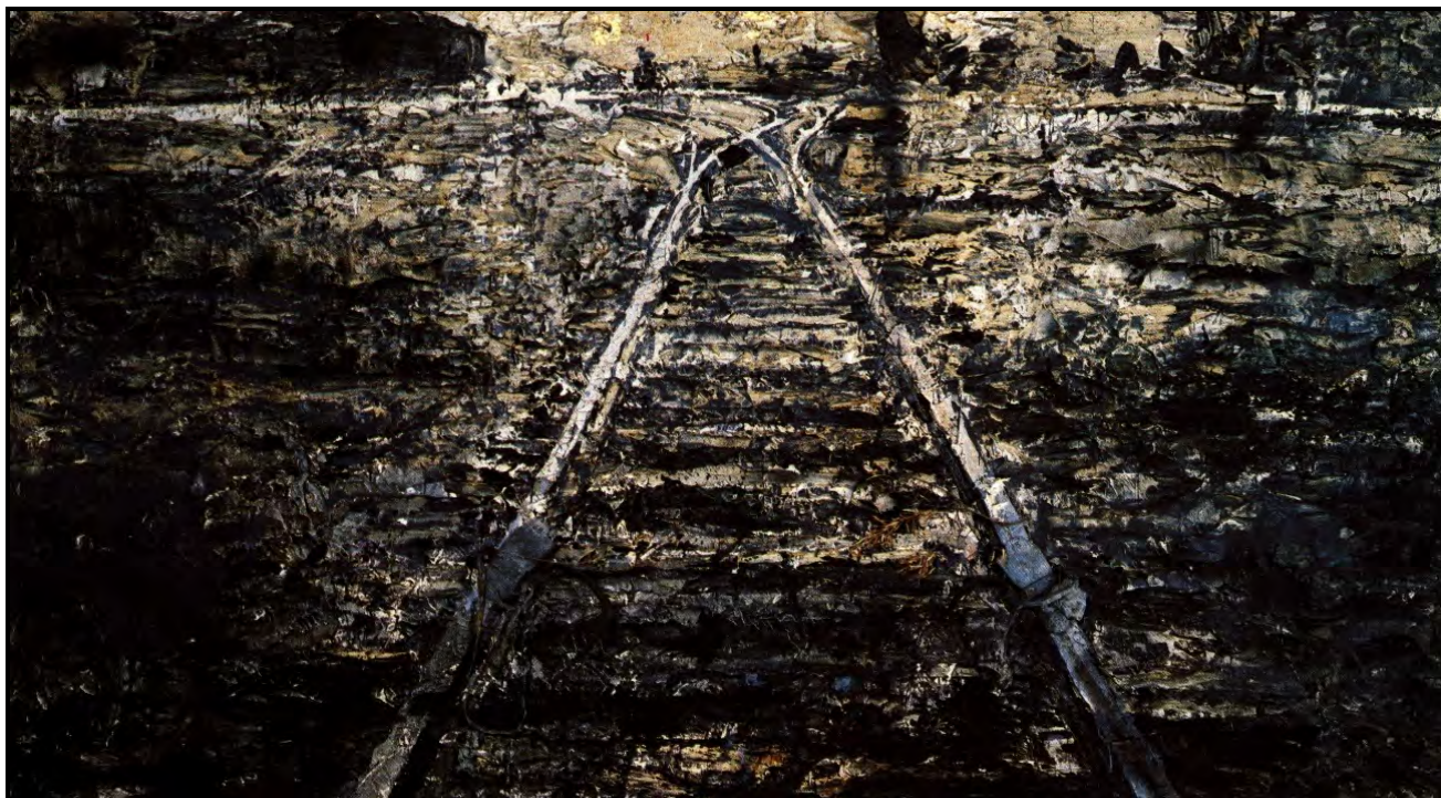
FIGUUR 3: Anselm Kiefer, Iron Road (Ysterpad) , olie, akriel, metaal en lood, olyftakke, yster en lood, 1986. Die treinspore wat na die Duitse konsentrasiekampe lei.

Landskap is die stille getuie van geskiedenis en stories.