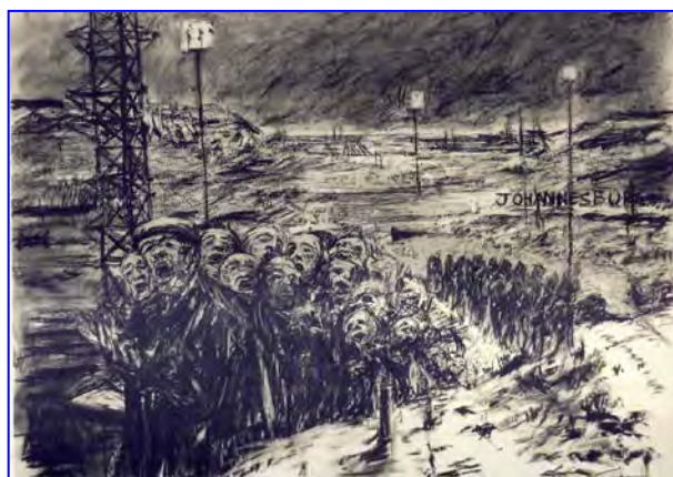
FIGUUR 7: William Kentridge, Johannesburg, 2 nd Greatest City after Paris (Johannesburg, 2 de Grootste Stad naas Parys) , houtskooltekening, 1989.

Drome is ons enigste aardrykskunde – ons geboorteland.