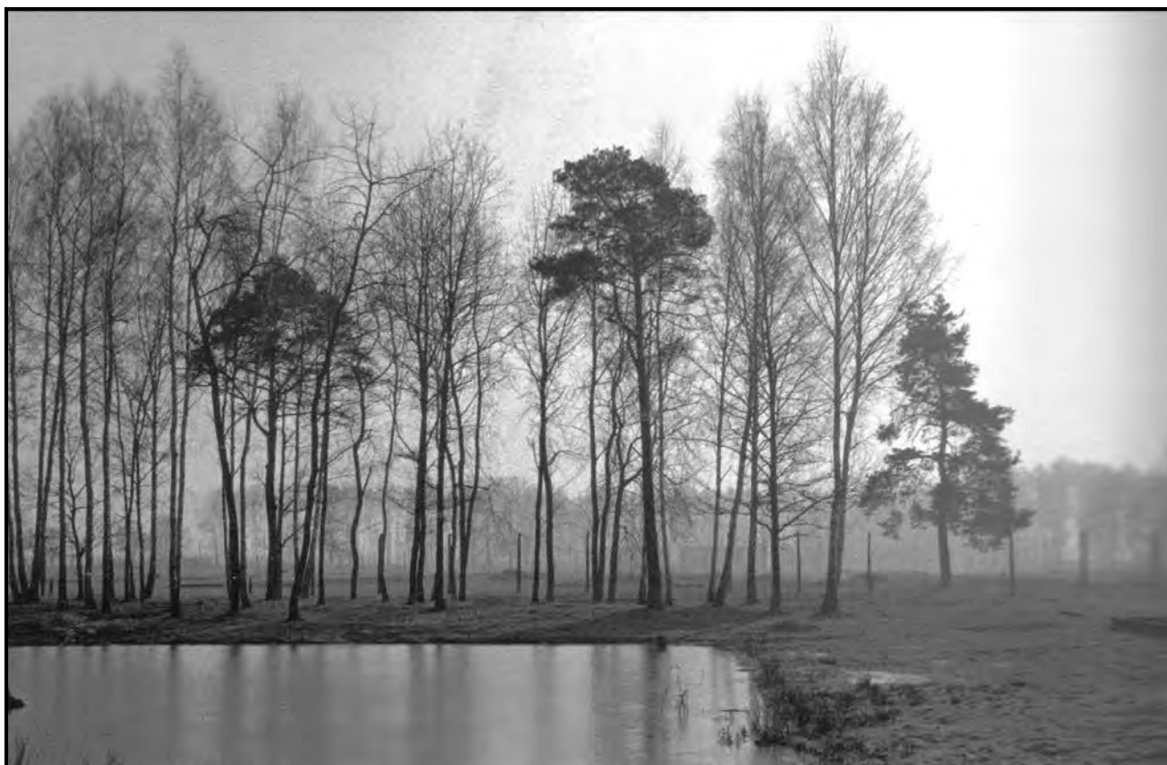
FIGUUR 4: Santu Mofokeng, Birkenau – KZ2, Poland (Pole) , foto, 1997–1998. Die meer waar Jode se as weggegooi is.