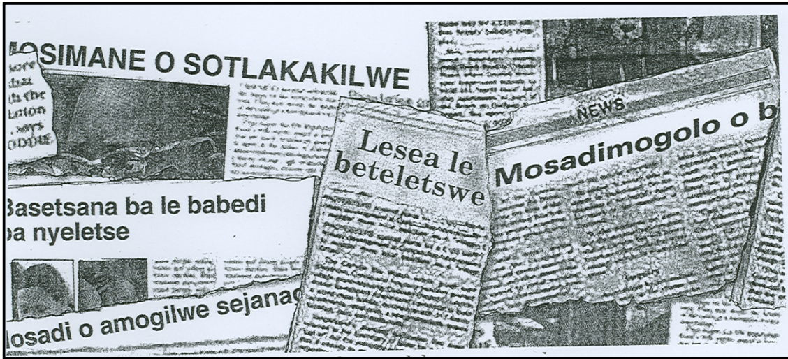
[Setswana Tota, ME Serobatse]